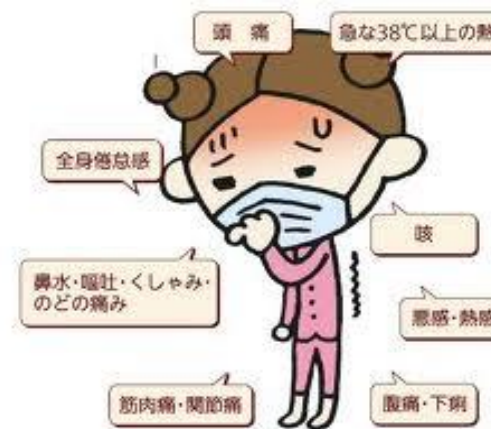
インフルエンザの主な症状